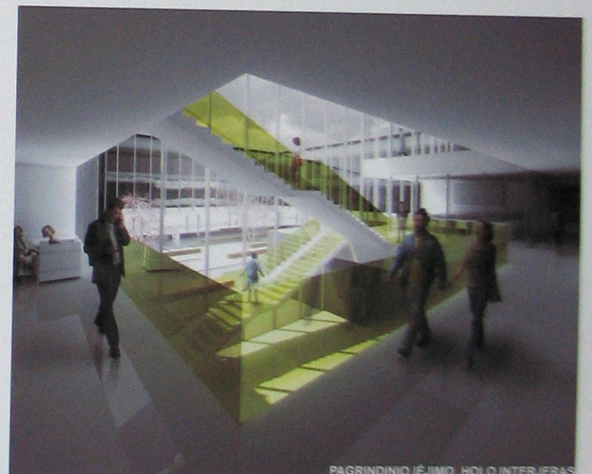
PAGRINDINIO ĮĖJIMO HOLO INTERJERAS