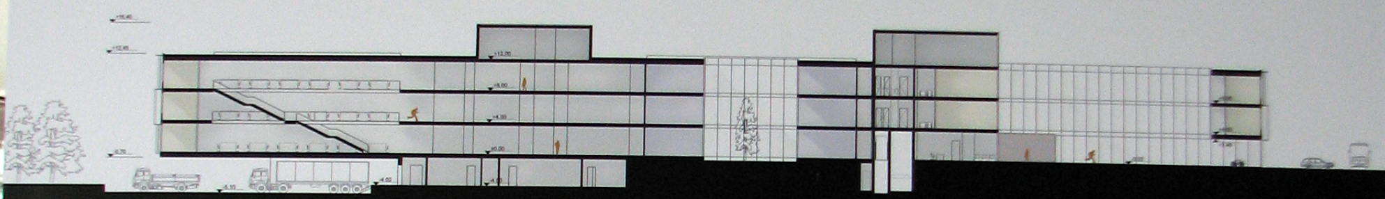
PJŪVIS 1-1 m1:250