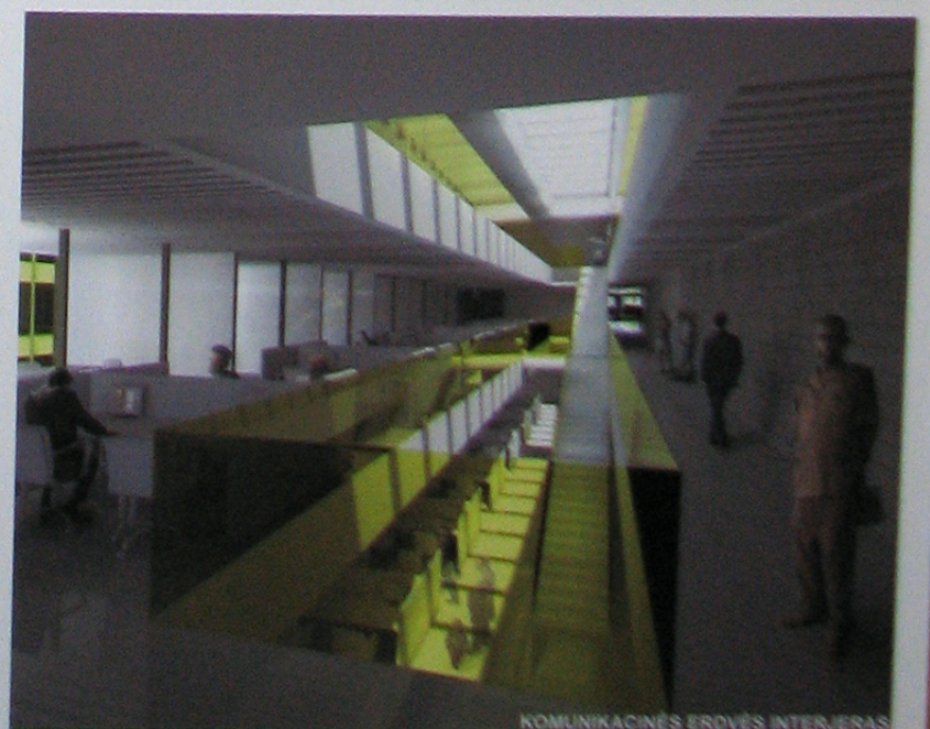
KOMUNIKACINĖS ERDVĖS INTERJERAS