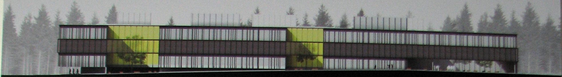
RYTINIS FASADAS m1:250